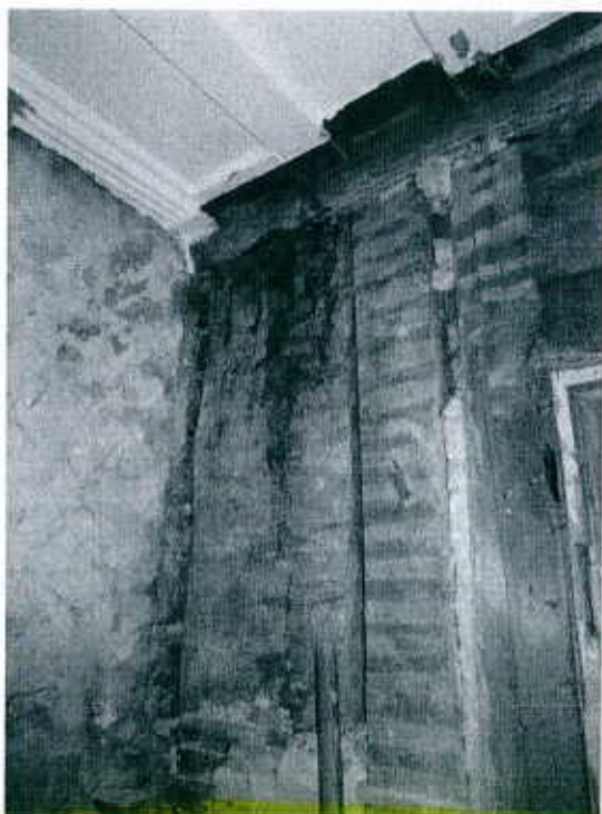
Murs porteurs intérieurs affectés par la pourriture sèche