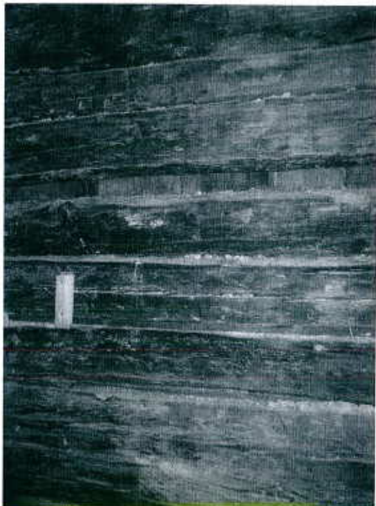
Murs extérieurs grandement affectés par la pourriture