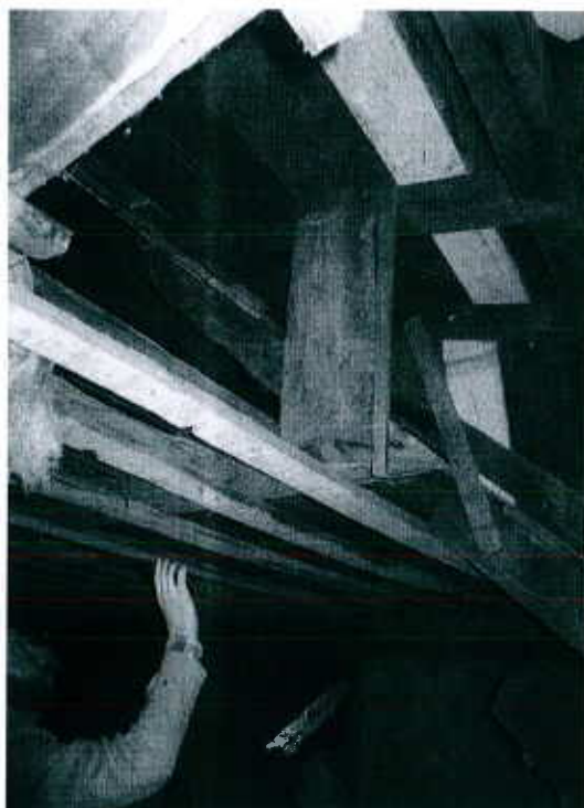
Ferme de toit tronquée