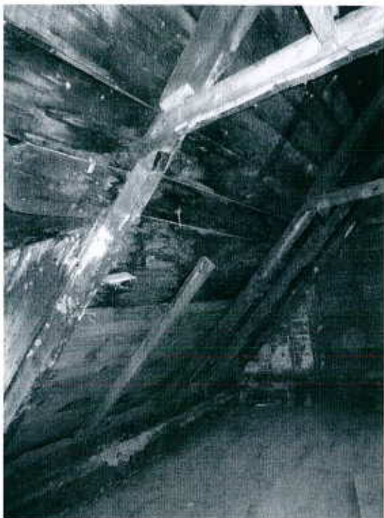
Ferme de toit manquante