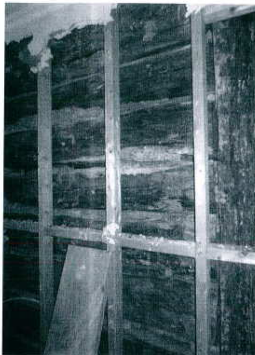
Les bâtis en 2"x4" seront conservés