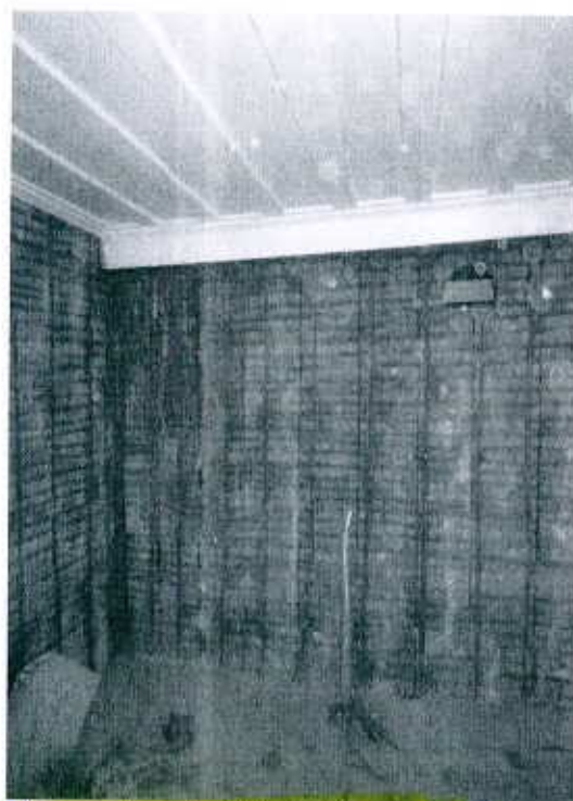
Murs porteurs intérieurs affectés par la pourriture sèche