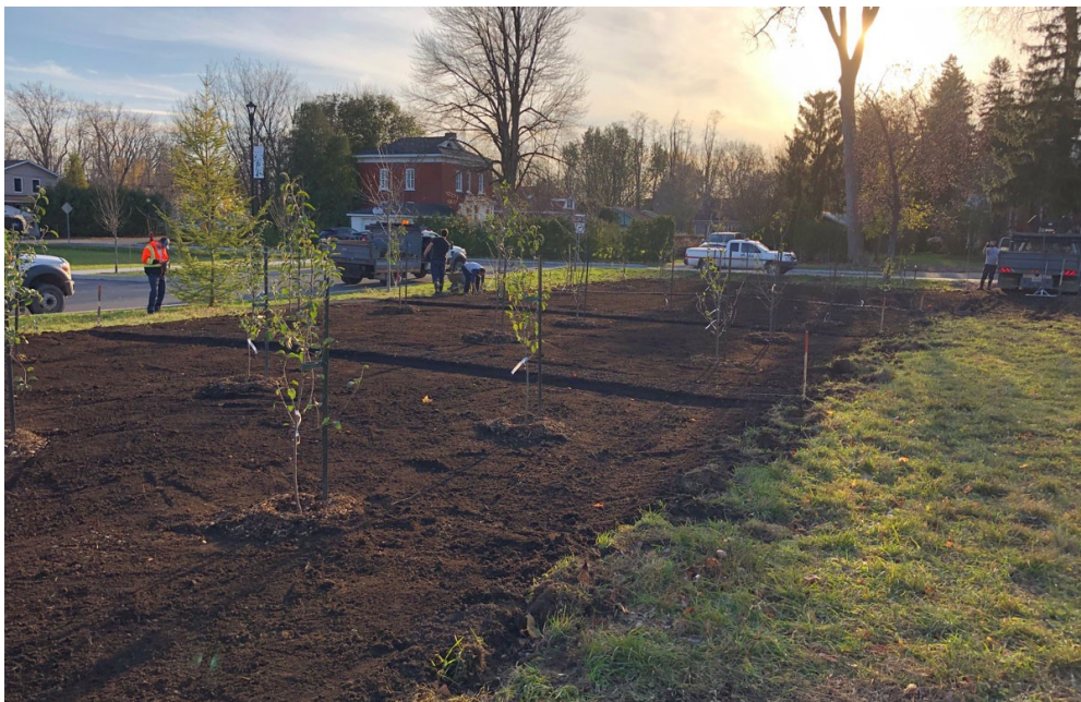
Image 1: Exemple de projet de verger urbain: St-Jean-sur-Richelieu